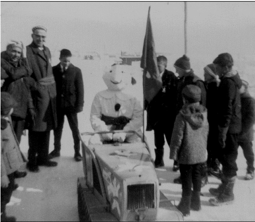
Une partie de la parade regroupée sur la patinoire extérieure en 1965.