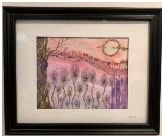
« Forêt enchantée (Aquarelle) »