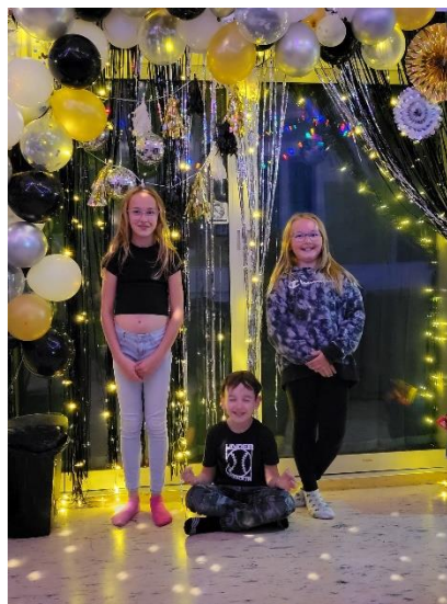
Des enfants heureux de l'ouverture de la petite Maison des Jeunes.