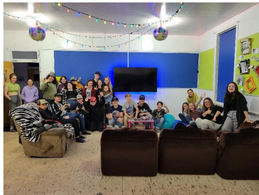
Nos ados lors du party d'ouverture posent devant la nouvelle télévision offerte par notre CDL.

Notre Maison des Jeunes et des petits a littéralement le vent dans les voiles.